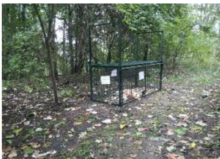
Klec umístěná v Krásném Březně