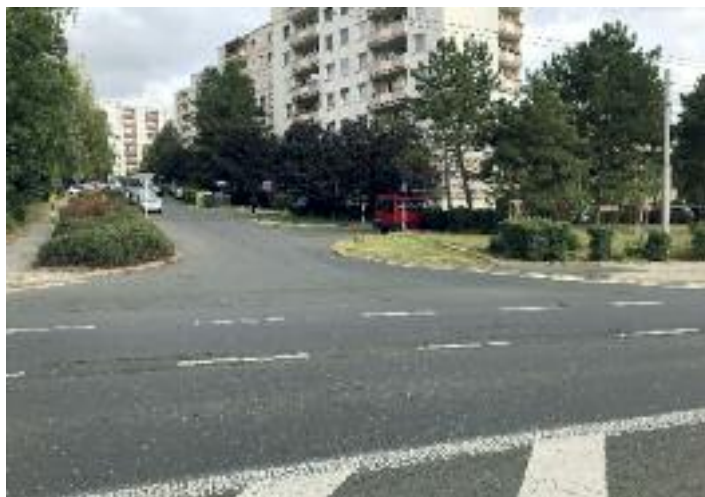
Neštěmická ulice po úpravě keřů

Rozpočet na celkovou údržbu zeleně, tj. seče intravilánu, extravilánu, úprava keřů, prořezy a kácení stromů, výsadba, následná péče výsadeb vč. pletí, zálivky, řezů, revitalizace a čištění zelených ploch, odplevení chodníků, frézování pařezů a další nutné úpravy zeleně byl ve výši šest miliónů korun.