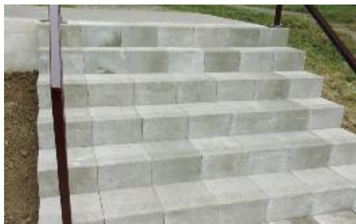
v ulici Obvodová před