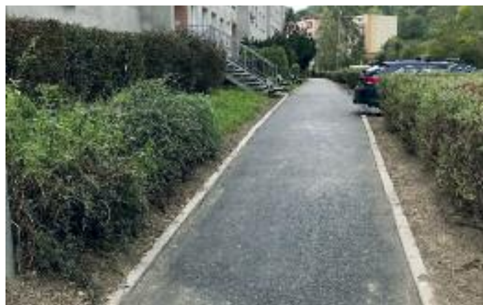
ulice Přemyslovců po