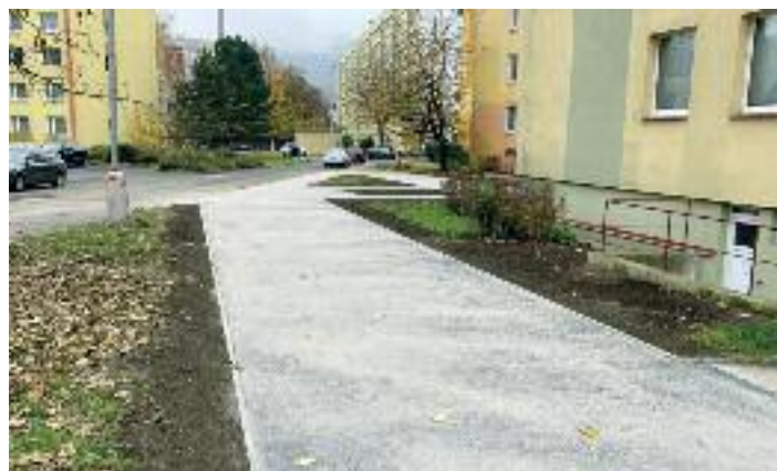
U Pivovarské zahrady po

Opravy chodníků a schodů v obvodu, v druhé polovině roku proběhla oprava chodníků v ulici Obvodová mezi domy 4 a 2, kde byl asfalt vyměněn za zámkovou dlažbu, do nového asfaltu se oblékly tři chodníky v ulici Přemyslovců od čísla 6 do 12, spojovací chodník k základní škole a podél domu s čp. 18. Po zámkové dlažbě se bude nově chodit po chodníku Na Skalku podél protihlukové zdi, která se také v příštím roce opraví a následně bude opatřena kresbou. Od poloviny října začala oprava rozbitého chodníku u zadních vchodů U Pivovarské zahrady 28 a 26 a bude opravena část chodníku v ulici Sibiřská naproti mini-pivovaru u zrcadla. Dále je naplánovaná oprava celého chodníku v ulici Neštěmická od křižovatky s ul. Výstupní po chodník pod domem Neštěmická 1 naproti Corsu.