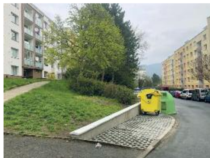
Ulice Peškova, úprava kontejnerového stání