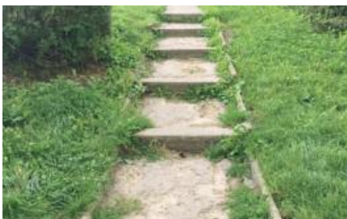
Husova ulice před