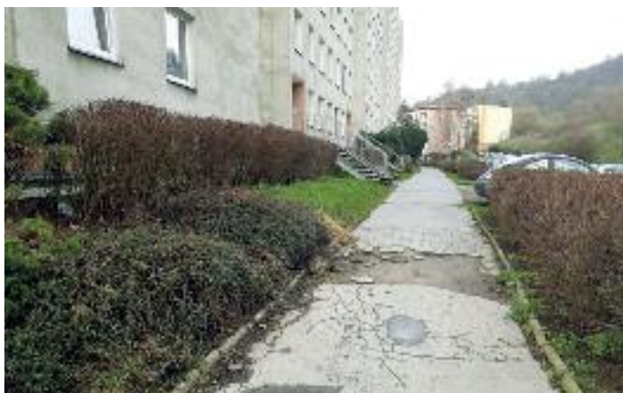
ulice Přemyslovců před