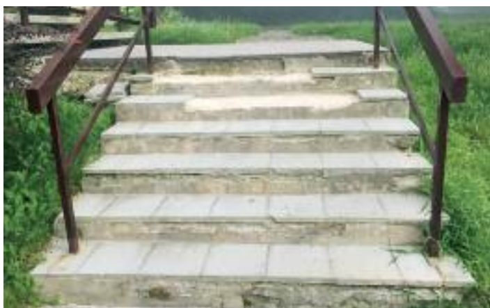
v ulici Obvodová před