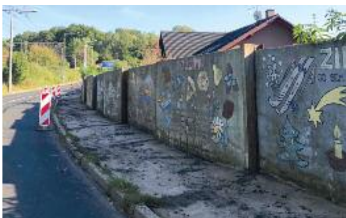
Skalka před opravou