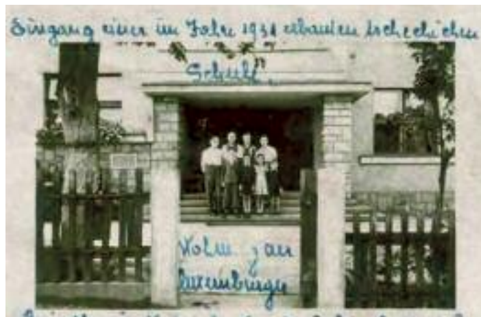
Lucemburská rodina před ubytovnou 121a