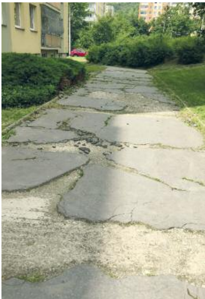
U Pivovarské zahrady před