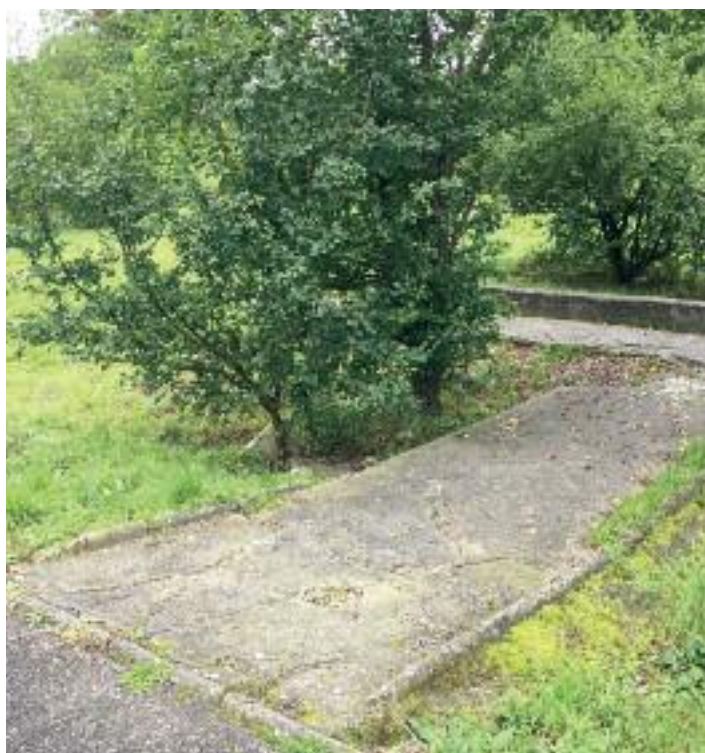
Sídliště Vyhlídka, za tenisovými kurty před a po

V říjnu bylo ve spolupráci s dopravním podnikem pokáceno několik stromů zasahujících do trolejového vedení, všechny dřeviny byly povoleny odborem životního prostředí Magistrátu města Ústí nad Labem. Za pokácené stromy budou vysazeny v příštím roce nové. Dále trvá i spolupráce se ZOO, které se poskytují podlimitní nebo OŽP povolené dřeviny, zejména ovocné stromy nebo např. vrba, kterých se vlivem povětrnostních podmínek několik zlomilo a vyvrátilo. I letos byly vydány objednávky na následnou péči za vysazené stromy, přesto se některé neujmuly a budou znovu vysazeny. Do konce roku dojde k plánovaným prořezům stromů v parku U Pivovarské zahrady a další etapa stromů v zámečném parku, prořezy provede certifikovaný arborista. Nové výsadby budou objednány v průběhu listopadu dle zbývajících