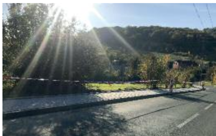
Skalka po opravě