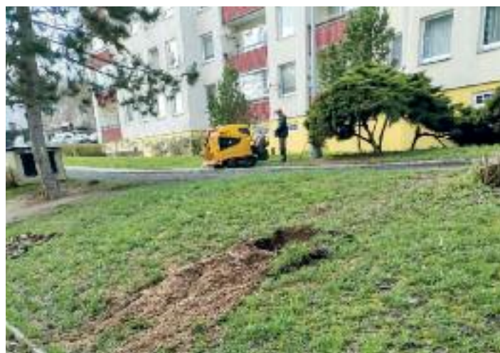
Frézování V Oblouku