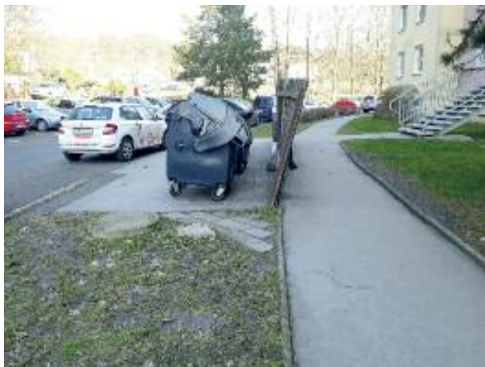
Ulice Keplerova, před opravou