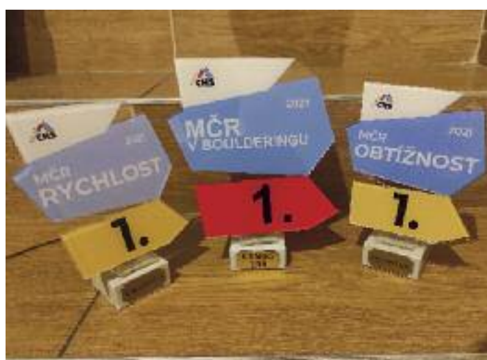
Honzův úlovek – třikrát první místo