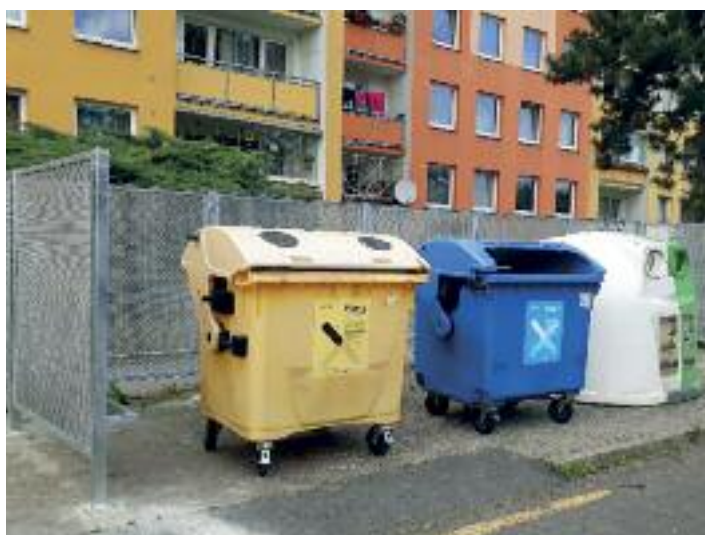
Ulice Keplerova, nové kontejnerové stání