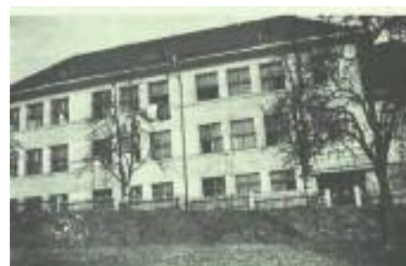
Ubytovna, tehdejší česká škola, dnes ZŠ praktická ve Studentské ulici

Bývalá česká škola byla od září 1943 obsazena ukrajinskými kolaboranty, kteří utekli před ru-