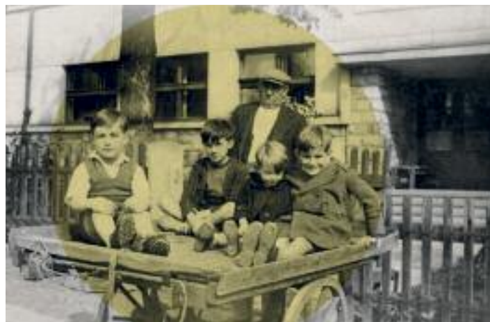
Vysídlení Lucemburčané před ubytovnou 121a