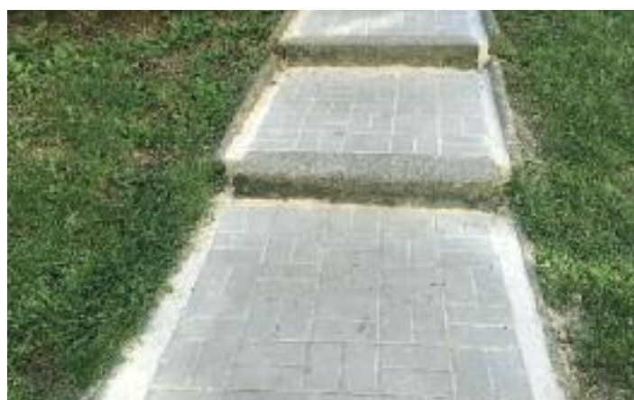
Husova ulice po