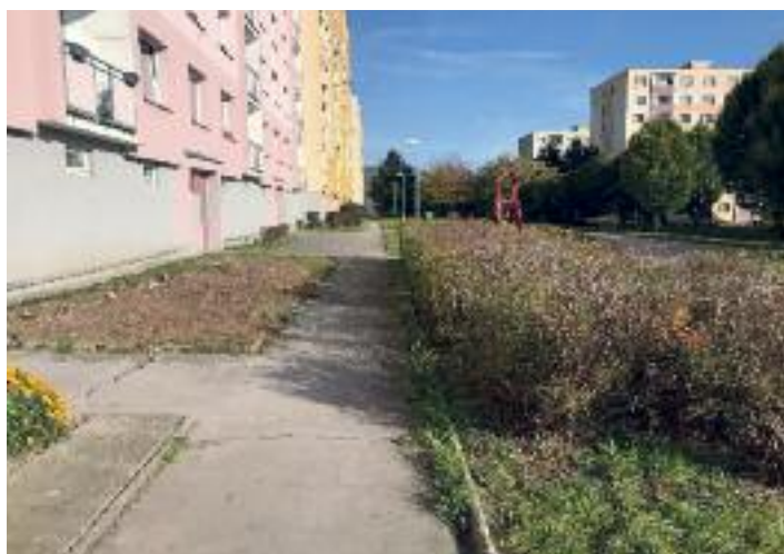
Ulice Peškova, po úklidu a odstranění jalovce, komunální odpad v keřích