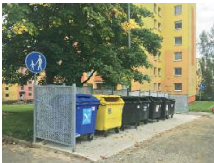
Ulice Na Sklípku, nové kontejnerové stání

O d letošního léta se podařilo získat finanční prostředky na vybudování nového kontejnerového stání v ulici Na Sklípku mezi domy 39 a 41 a v ul. Vojanova mezi domy 56 a 37, a také na opravu stávajících kontejnerových stání v ulici Keplerova. Nový povrch získalo kontejnerové stání na tříděný odpad mezi ulicemi Peškova a Picassova.