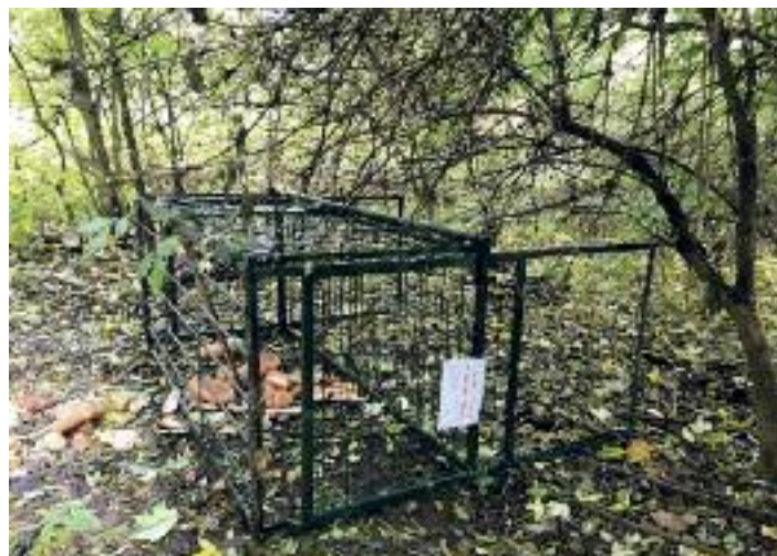
Poničená klec vandaly