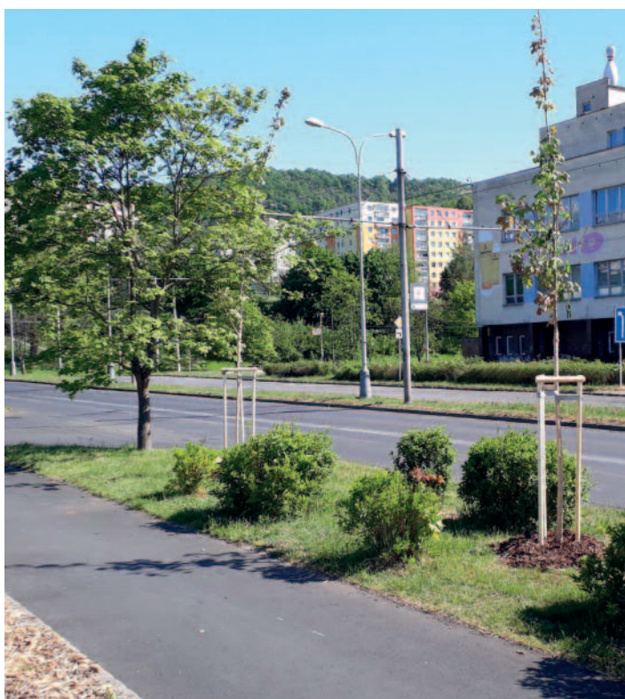
Javorý v Krčínově ulici