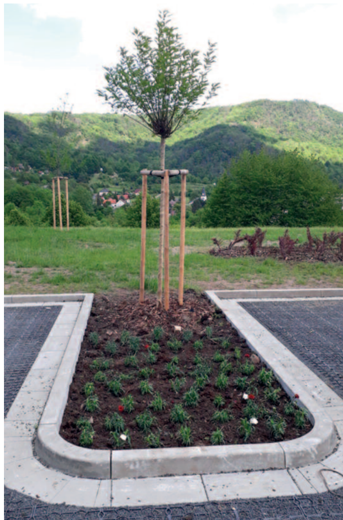
Výsadba letniček Skalka