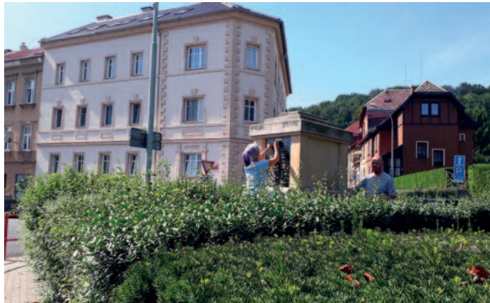
Válečný hrob U Radnice