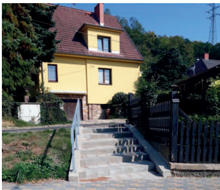
Nové schody Hlavní/Žitná