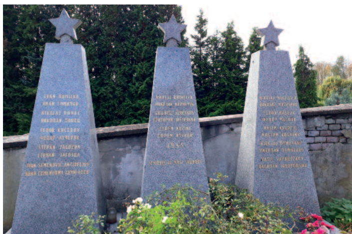
Válečný hrob V Mojžíři