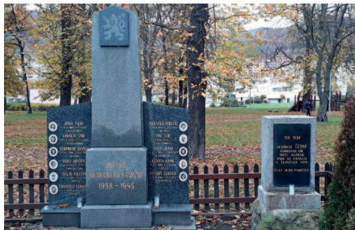
Válečný hrob U Pivovarské zahrady