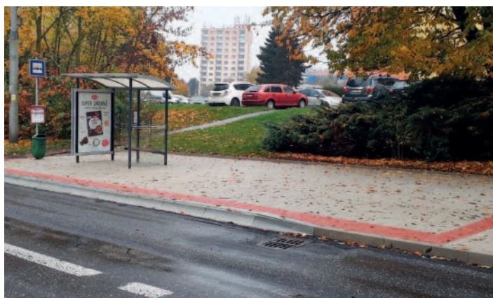
Chodník a zastávka MHD Keplerova/Na Sklípku