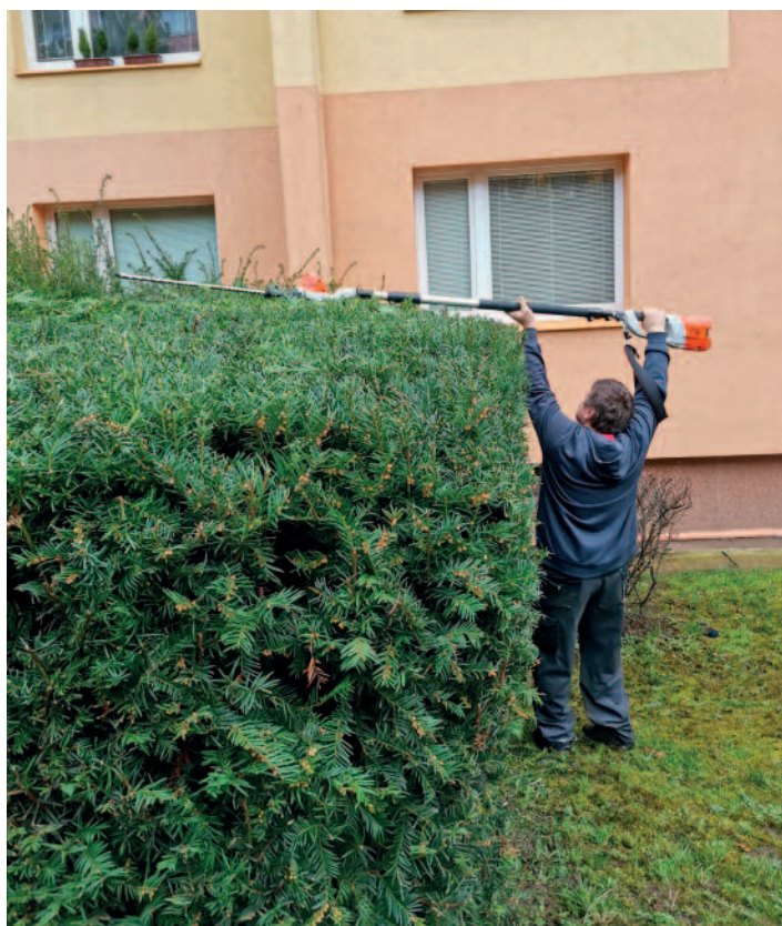
Úprava keřů na Skalce