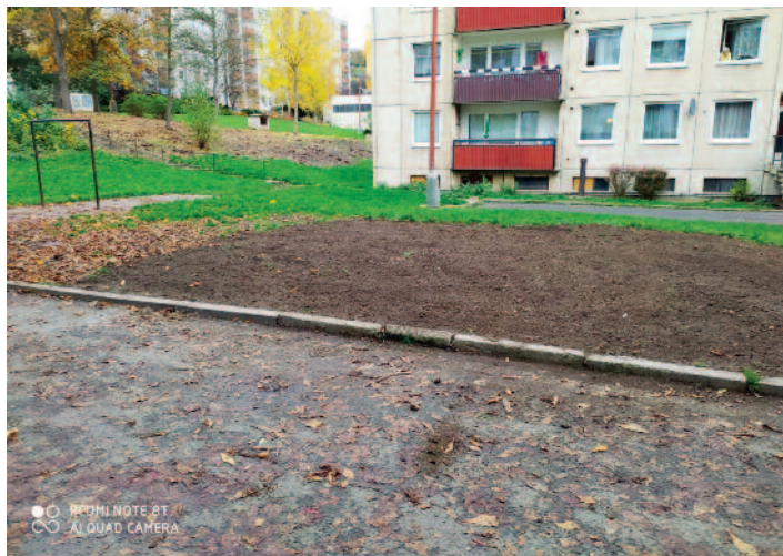
Likvidace pískoviště v ulici Dr.Horákové