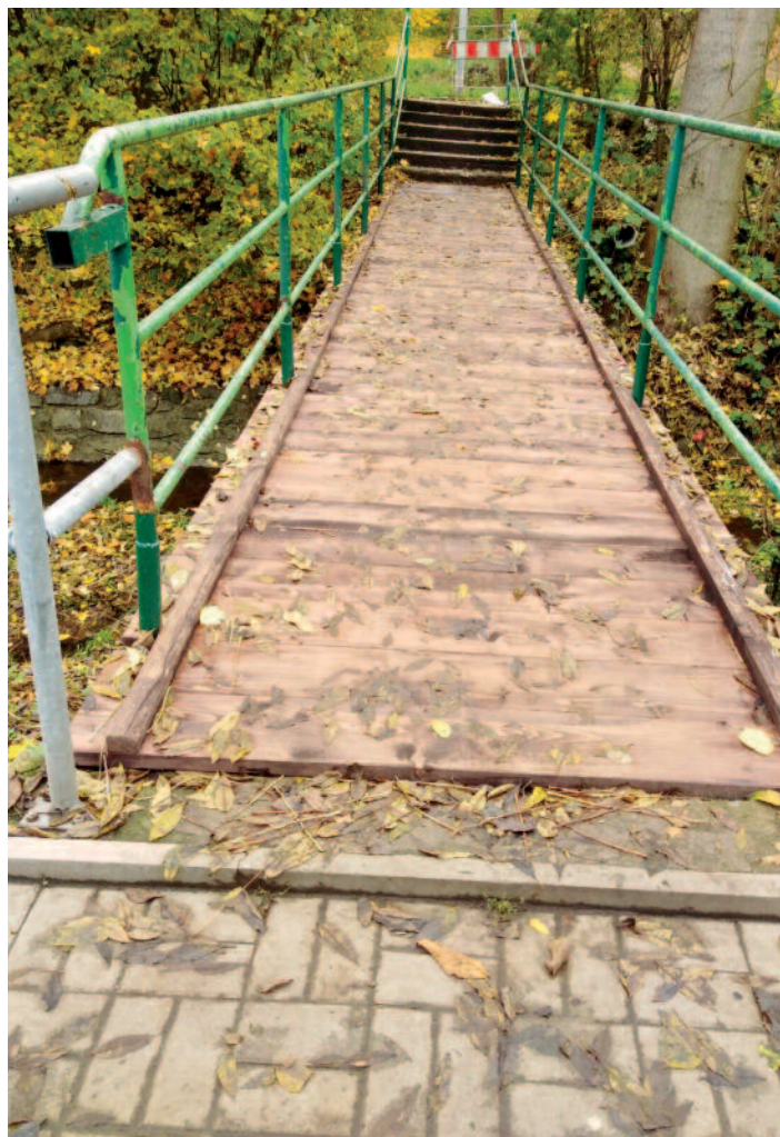
Lávka Neštěmický potok