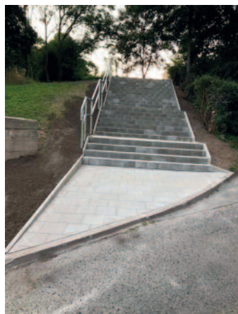
Nové schodiště a zábradlí z Neštěmic na Výšinu