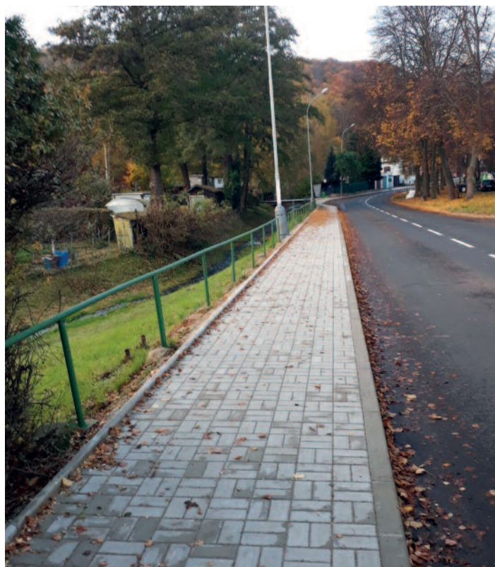
Chodník Sibiřská ulice