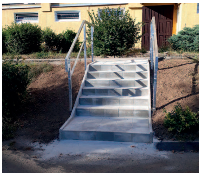
Oprava schodů A. České