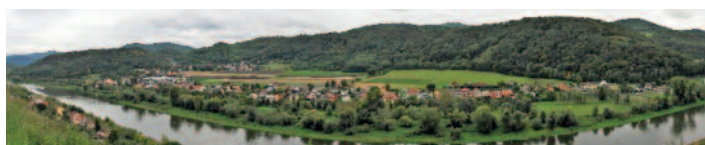
Pohled z Málkovy vyhlídky