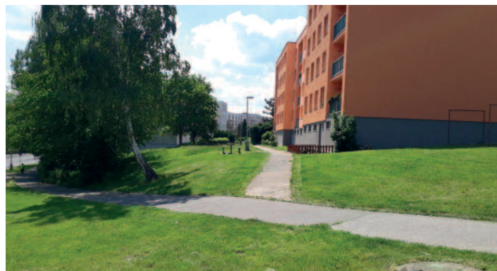
Seče v Krásném Březně