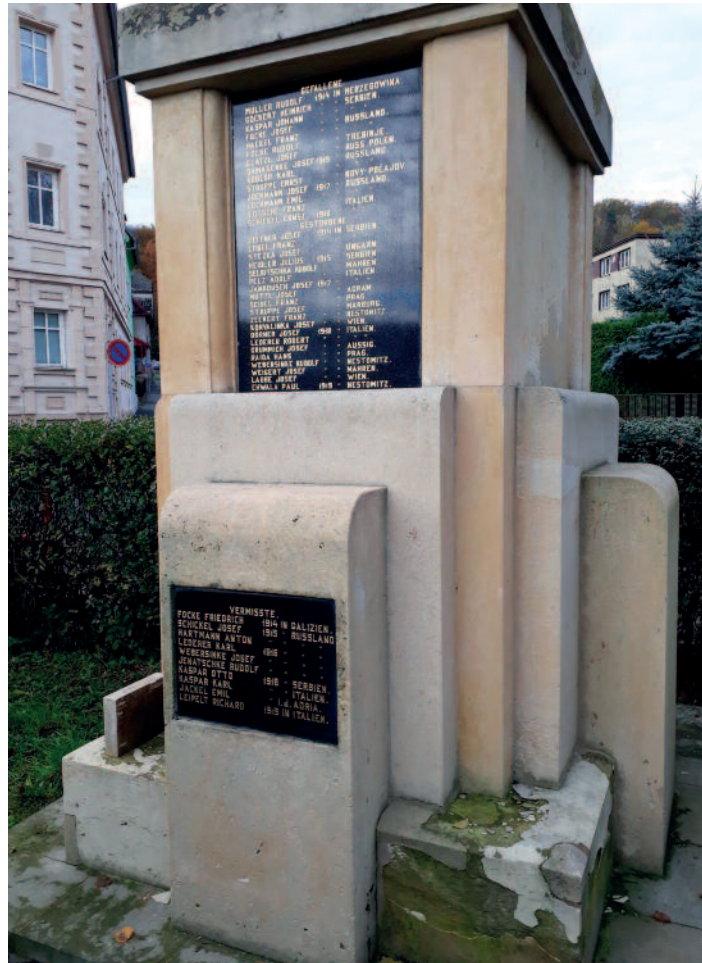
Opletalova u parku