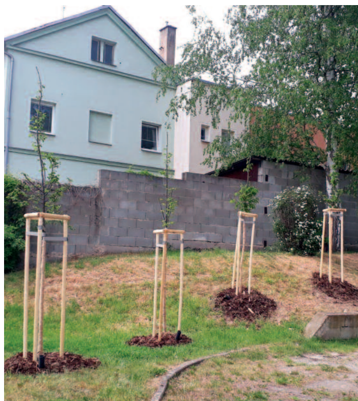
Habry v Drážďanské ulici