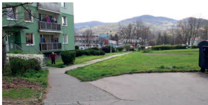
Zahájení seči – V Oblouku Krásné Březno

Právě v tuto dobu trávníky rostou a je potřeba je sekat. Pokud se seká v tuto dobu, kdy tráva roste (vlhko a teplota 15-20 st. C) a po posekání i více odnožuje a zahušťuje se a omezuje se růst dvouděložných. Jakmile teploty stoupnou nad 25 stupňů, budou seče omezovány na minimum. Optimální seč trávy je o 1/3, max. o 1/2, což se snažíme ve většině případů dodržovat. V některých lokalitách ponecháváme na extenzivních plochách neposekané pruhy či větší místa jako tzv. mozaikovou seč. Do konce května budou v některých lokalitách trávníky posečeny dvakrát a další seče budou plánovány v jednotlivých lokalitách dle klimatických podmínek a růstu trávy. Názory na sečení travnatých ploch se různí, jedni volají sekat, ale bez hluku, druzí nesekat. Jarní posečení travnatých ploch určitě chyba nebyla, sídliště jsou zelená a upravená.