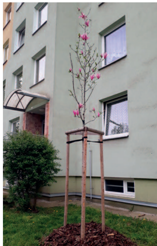
Vojanova – magnolie