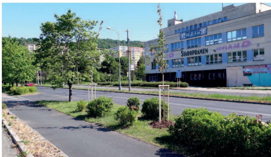
Krčínova – javory

První jarní květy cibulovin se na začátku jara objevily ve středovém pásu čtyřproudové komunikace ulice Krčínova, další tulipány se červenalily podél komunikace ulice Podmokelská a v barvách žluté červené oranžové několik týdnů těšily oko kolemjdoucích různorodé cibule na křižovatce Seifertova a Sibiřská. Barvy slunce se prolínaly s růžovými květy sakur po celém obvodu a několika keřovitých magnolií, které jsou vysazeny v parku před radnicí, u přechodu k poště, na křižovatce ulice Sibiřská, v předzahrádkách naproti Tesco a stromových magnolií v předzahrádce ulice Železná a Vojanova. Žluto fialové několik měsíců pokvete středový ostrůvek před Albertem. V záhonu před úřadem by měly růžově rozkvést růže, které doplňují fialové květy šanty.