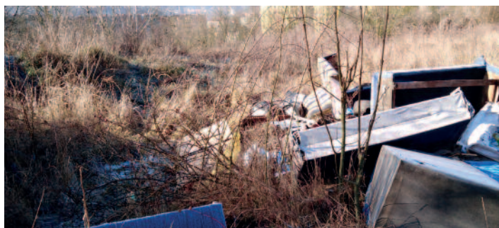
Velkoobjemový odpad ulice Žežická před zahradami

Odklizení odpadků mimo svozy stojí značné finanční prostředky,