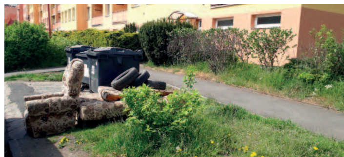
Objemný odpad ulice Žežická