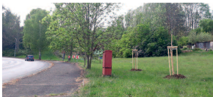
Výstupní - jeřáby