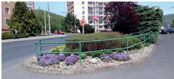
Rozkvetlý ostrůvek v Neštěmících

V Krásném Březně od dubna do května doplnilo květenu 36 vysazených stromů, v ulici Vojanova v sídlišti bylo obnoveno stromořadí 20 exemplářů jeřábů, obnoveno bylo i stromořadí v ulici Krčínova výsadbou 8 ex. javorů, v parčíku mezi ul. Vojanova a Drážďanská poroste 5 ex. habrů,