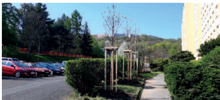
Vojanova – jeřáby