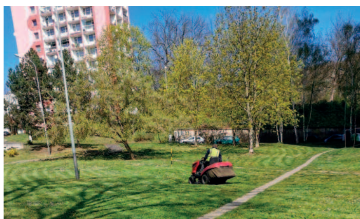
Seče v Neštěmicích