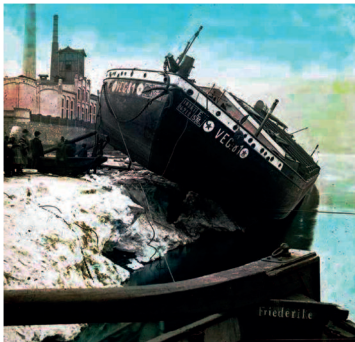
Oprava labského člunu v Neštěmicích v roce 1920