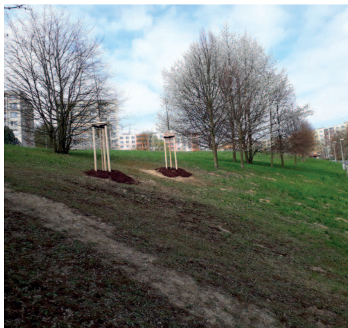
Peškova ulice – doplnění stromořadí dvěma lípami srdčitými