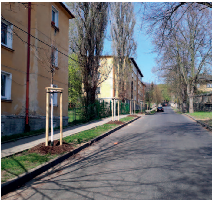
Vojanova ulice – výsadba 33 lip