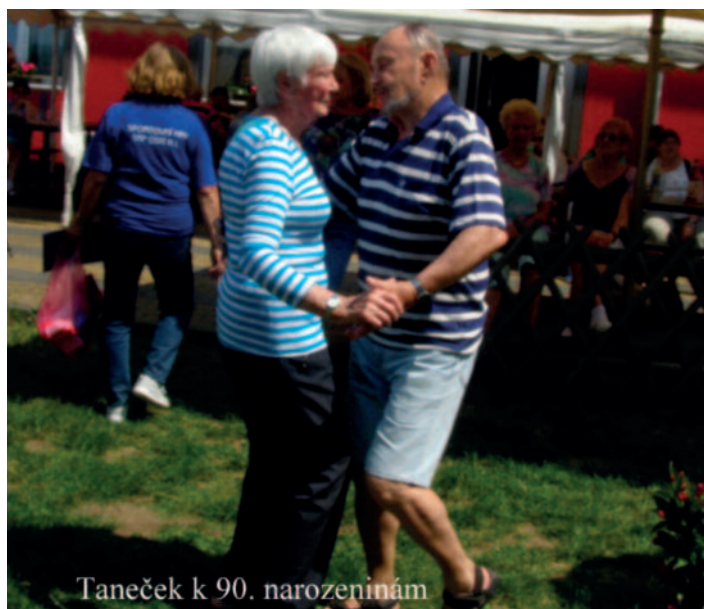
Taneček k 90. narozeninám