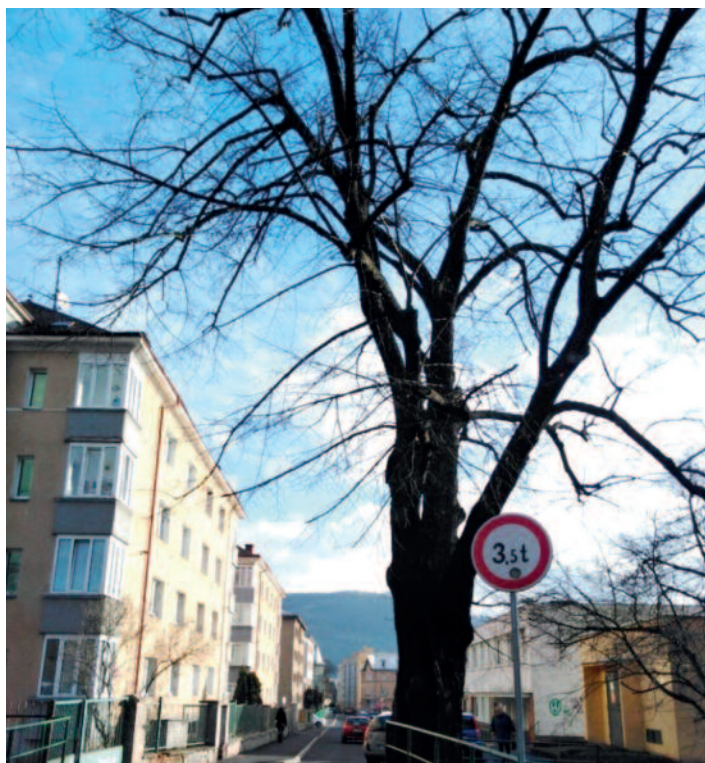
Lípa před kácením