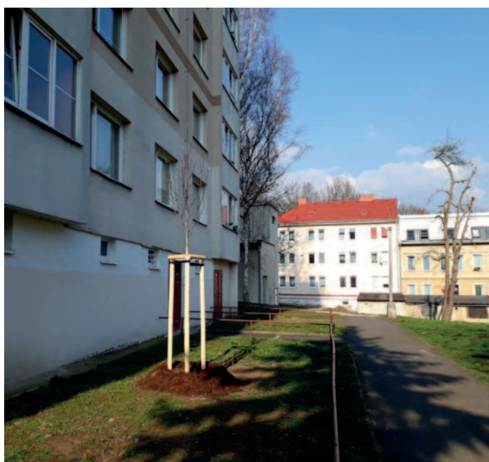
Železná ulice – magnolie