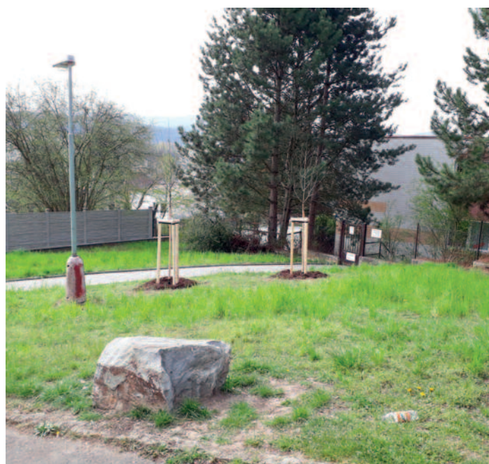
Horní ulice – výsadba dvou hlohů