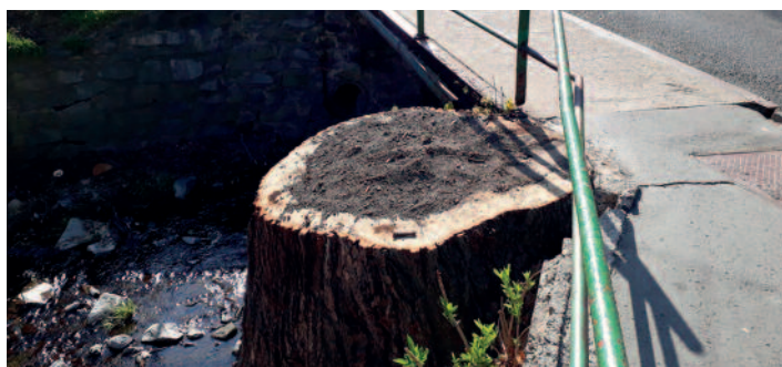
Zасыpaný pařez po kácení