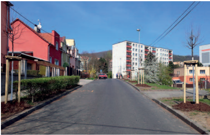
Vojanova ulice – výsadba 33 lip