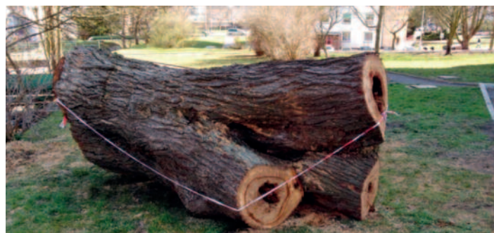
Kmen pro ústeckou ZOO