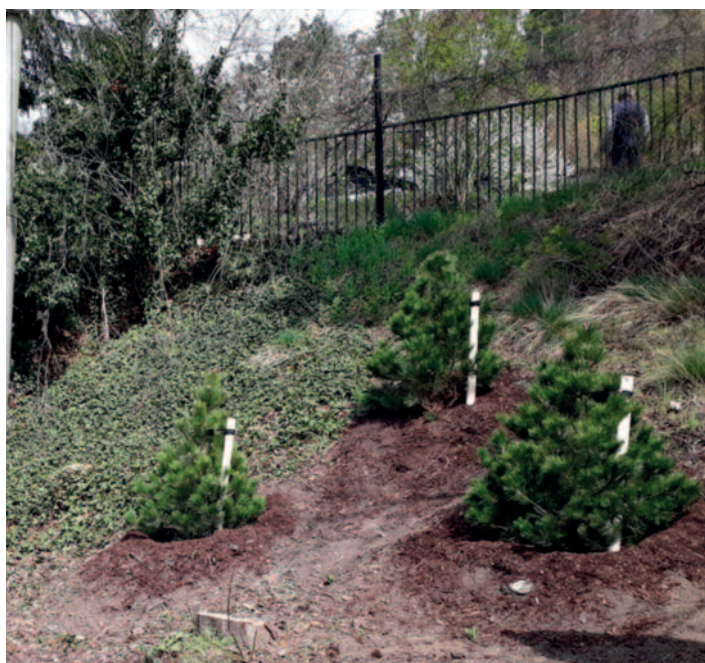
Žežická ulice, výsadba tří borovic černých