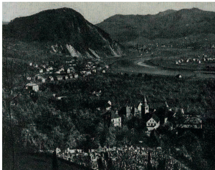
Pohled na Mojžíř a Veselí v době Jenatschkova mládí. Pozdější panelová výstavba změnila spodní část Mojžíře k nepoznání