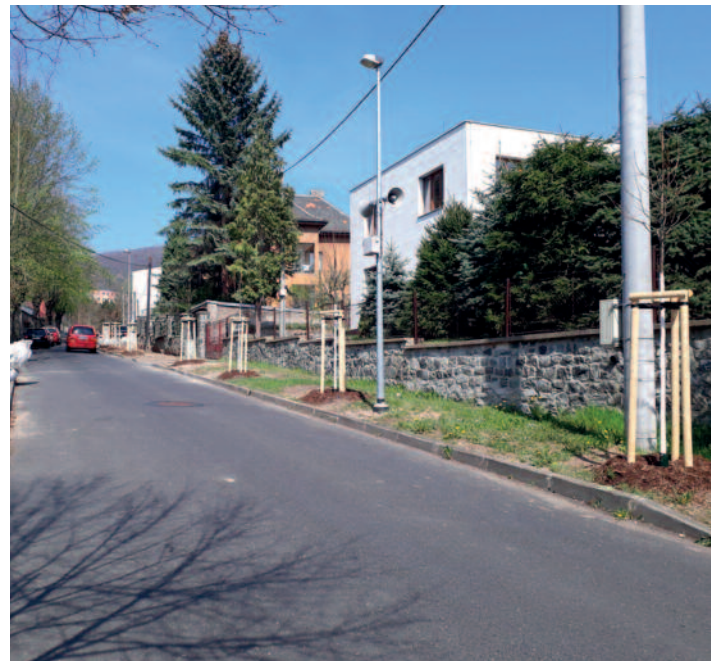
Vojanova ulice – výsadba 33 lip