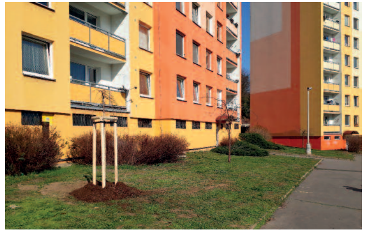
Žežická ulice – sakura