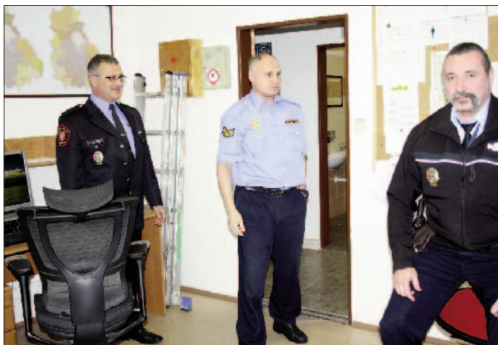
Mezi strážníky našeho obvodu

ných případech lze konstatovat, že trestná činnost je na ústupu, s čímž se shoduje s velitelem Městské policie, se kterou si pochvaloval výbornou součinnost a blízkou spolupráci. Stejně tak se vyjádřil o spolupráci s Městským úřadem Neštěmice. Aby tento pozitivní vývoj měl nadále úspěšný efekt, jsou policisté vysíláni do ulic, především tam, kde jsou vyšší rizika páchaní trestné činnosti. Policisté plní programy stanovené pro veřejný pořádek i pro preventivní opatření. Z jeho úhlu pohledu je bezpečnostní situace od 1. 1. 2017 velmi uspokojivá s lepším se trendem.