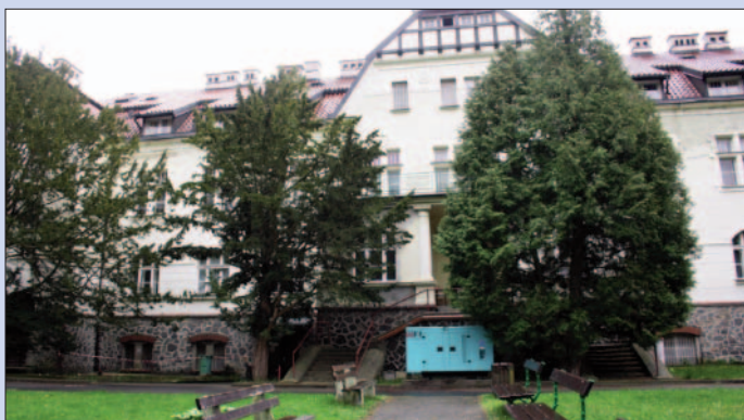
Nemocnice s následnou péčí Ryjice

V sousedství našeho obvodu máme i jedno významné zdravotnické zařízení, nemocnici s následnou péčí Ryjice. Mezi obyvateli je spíše známá jako eldeenka a mnozí jsou přesvědčeni, že pobyt v tomto špitálu