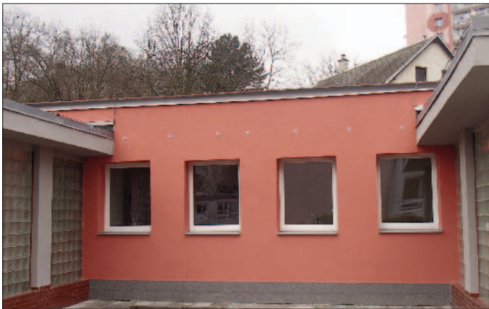
Zdravotní středisko v Hluboké ulici