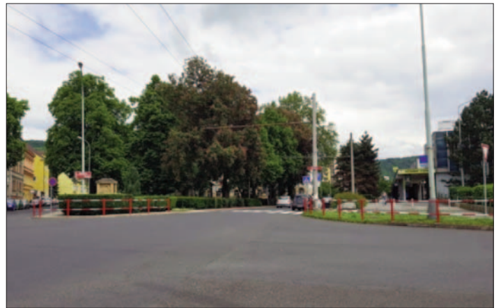
Nové zábradlí, Opletalova ulice