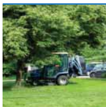
ÚDRŽBA ZELENĚ V ROCE 2011