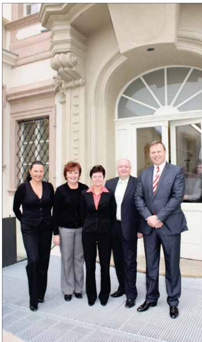
Před vstupem do nově opraveného zámku při slavnostním otevření, zleva

Krásnobřezenský zámek je jedna z nejceněnějších památek na Ústecku. Především však jeho zámecká kaple, kde se zachovala ukázka saské renesance z prvního desetiletí 17. století, tedy z přelomu vlády císařů Rudolfa II. a Ma-