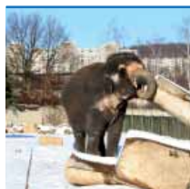
ZOO V ZIMĚ