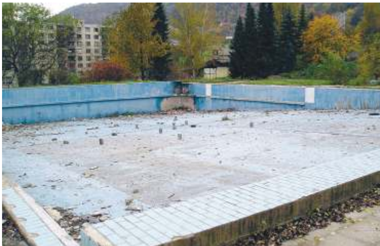
Bývalé koupaliště v Mojžíři už roky chátrá. Radnice z něj chce nyní vytvořit moderní sportovní areál.

V hrubých plánech se uvažuje o dráze pro kolečkové brusle, U-rampách, pinpongových stolech, lanovém centru, které budou zdarma přístupné. Po zaplacení poplatku si tu budou moci lidé zahrát i po-