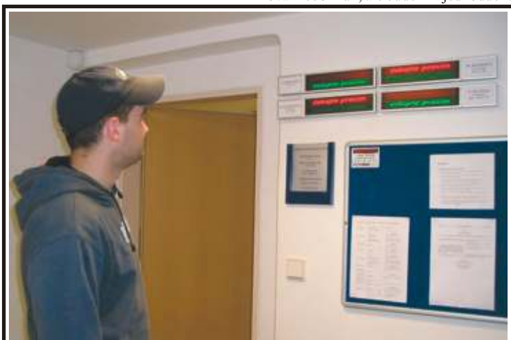
Lidé, kteří přicházejí na neštetickou radnici, už nemusejí tápat. Zde je v kanceláři úředníka jiný klient zjistí díky novým světelným tabulím. Ty jsou umístěny u všech kanceláří odboru sociálních věcí. Jejich nákup stál zhruba 120 tisíc korun.

„Okolo celého areálu povede tři metry široký chodník, v celkové délce zhruba 300 m, určený bruslařům. Nebude to ovál nebo kruh, ale bude mít jednoduchá