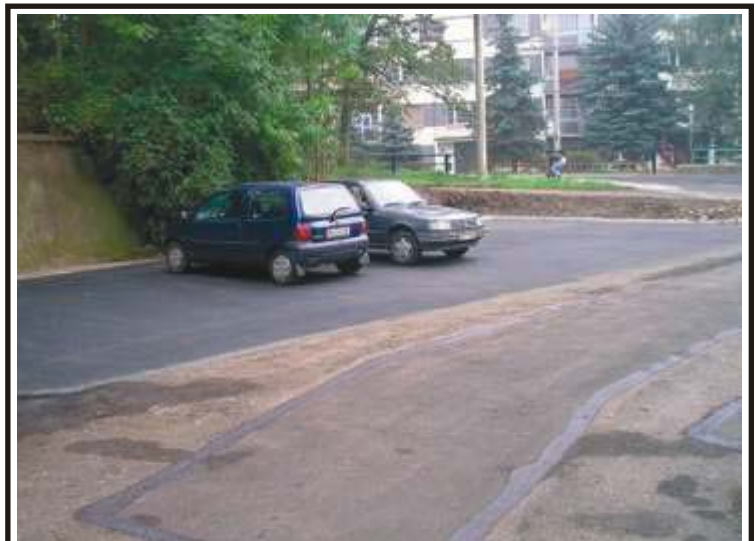
Obyvatelé domů v Sibiřské ulici už se nemusejí obávat přívalových dešťů. Voda jim totiž v minulosti opakovaně zatopila sklepy. Dělníci provedli rekonstrukci celé přístupové silnice. Rozšířili počet parkovacích míst a samozřejmě vybudovali odtokový kanál. Radnici vše stálo 800 000 korun.

Nabídka platí pro všechny obyvatele města, nejen neštémického obvodu.