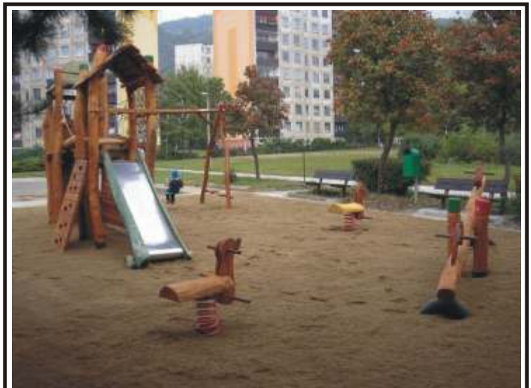
Nové dětské hřiště vzniklo v sídlišti Krásné Březno. Radnice ho nechala postavit za peníze, které ušetřila v letošním roce. Na jeho stavbě se podíleli i veřejně prospěšní pracovníci.