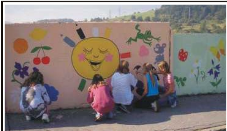
Děti ze Základní školy Mojžíř se rozhodly zkrásnit sídliště na Skalce. Pomalovali veselými obrázky původně šedivou protihlukovou zeď. Obvodní radnice jim k tomu nakoupila barvy za zhruba 15 tisíc korun.