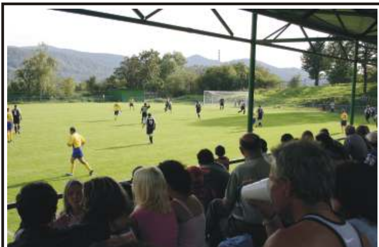
Fotbalové hřiště v Mojžíři má nový trávník. Slavnostní otevření se uskutečnilo poslední prázdninový víkend. Více na straně 2.

- opravy chodníků na 19 místech stojí více než 2 miliony korun. Za celé čtyři roky radnice investuje do podobných oprav 10 milionů;